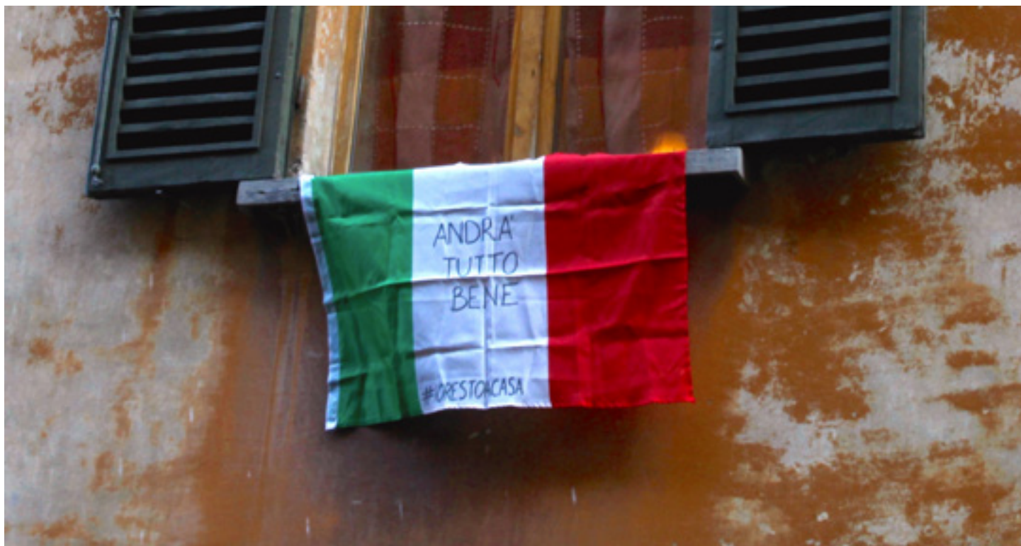
Все будет хорошо, Болонья, Италия, 2020.

рессы подконтрольных России «Донецкой Народной Республики» и «Луганской Народной Республики» в Совете Европы в 2019 году 52 .